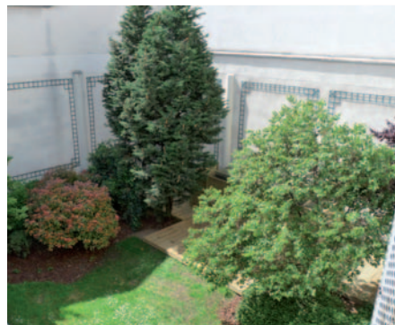
Coop de France : jardin