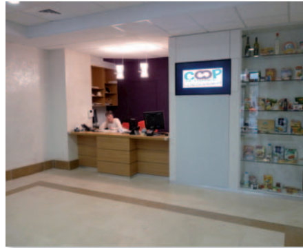
Coop de France : Hall d'accueil

Le 43 de la rue Sedaine a permis de rassembler toutes les activités fédérales, relier ces mêmes activités fédérales avec celles de prestations de services, constituer un pôle d'attraction pour toutes les fédérations, offrir les capacités d'accueil à chacun... y compris en se dotant enfin d'une salle de conseil d'administration ! Bref, Coop de France existe, vous pouvez la rencontrer rue Sedaine.